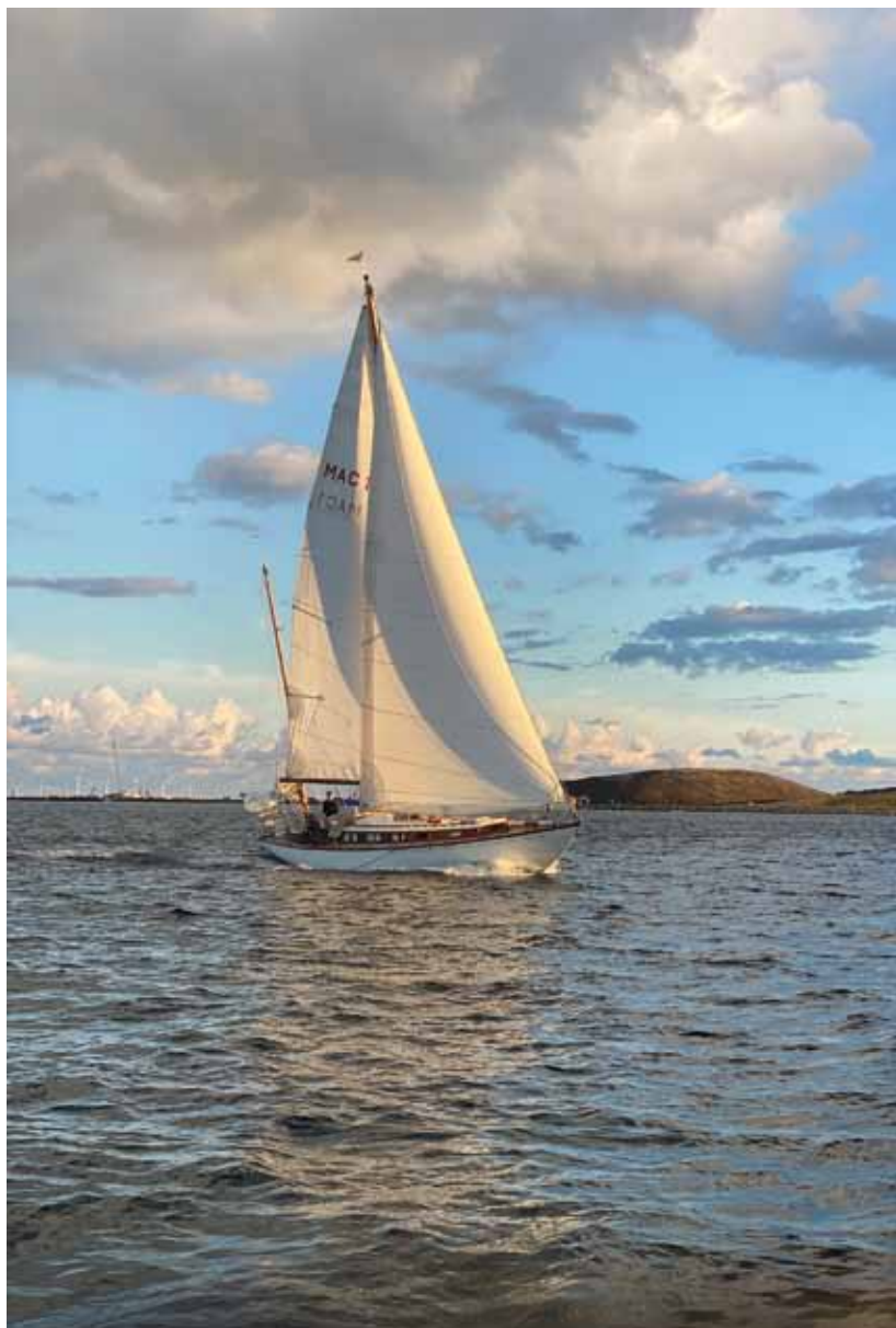
Rosa - til torsdagssejlads i Københavnske Træsejlere