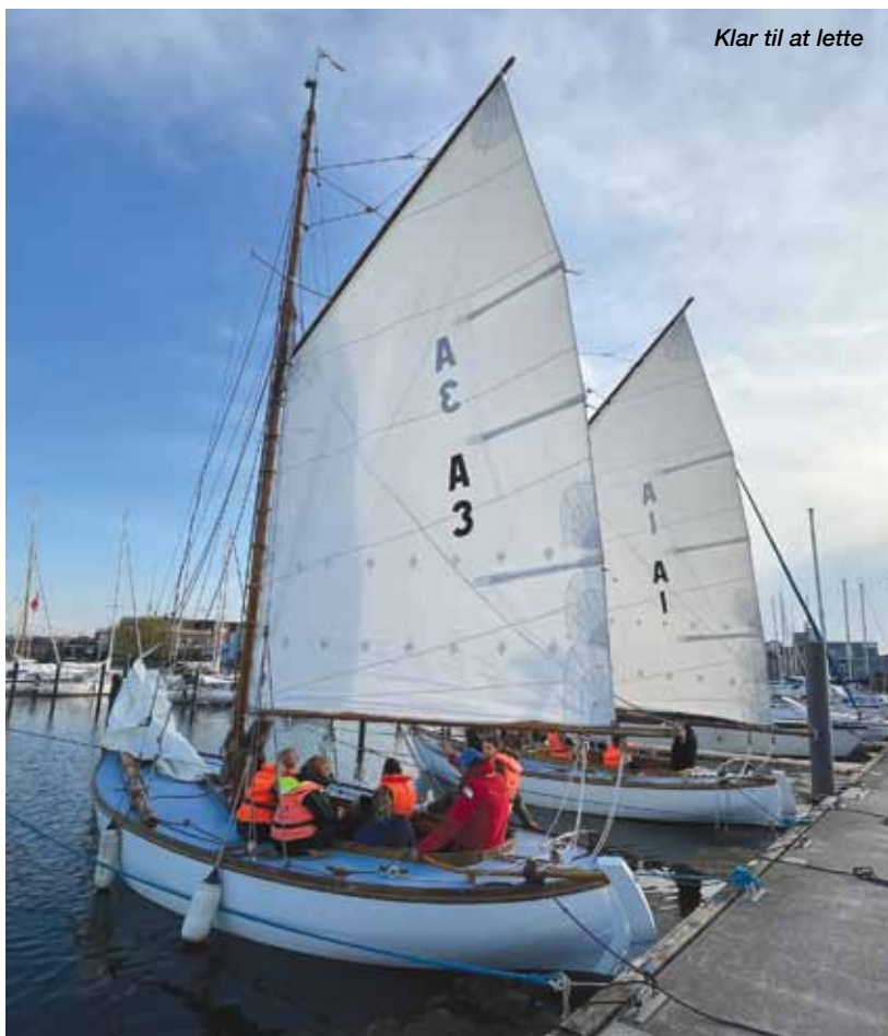
Klar til at lette

Førerprøven 2024 blev afholdt d. 6. oktober 2024. Oprindeligt ville vi have afholdt førerprøven lørdag d. 5. oktober, men der var IN-