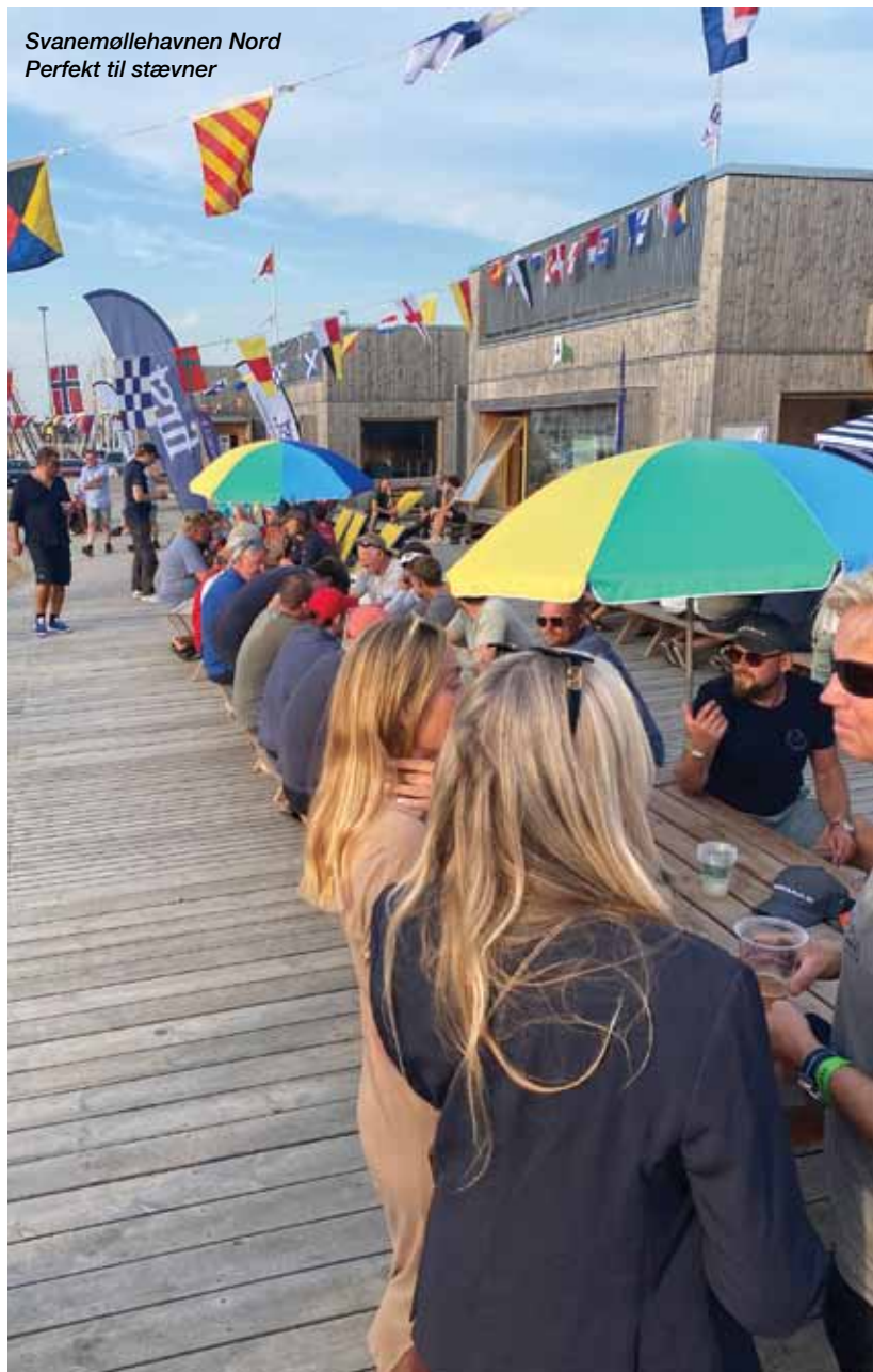
Svanemøllehavnen Nord Perfekt til stævner