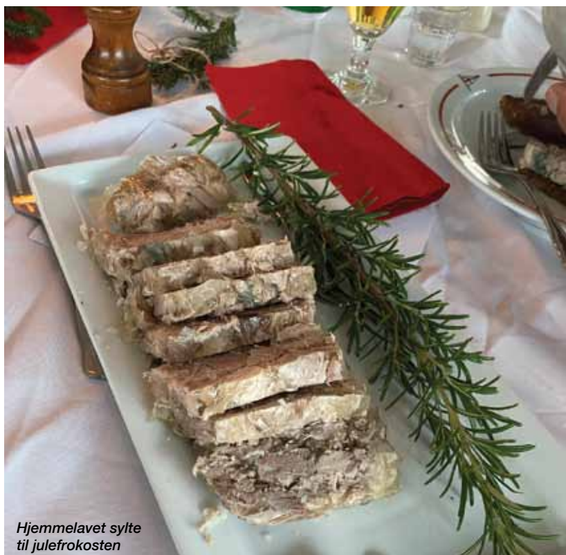
Hjemmelavet sylte til julefrokosten