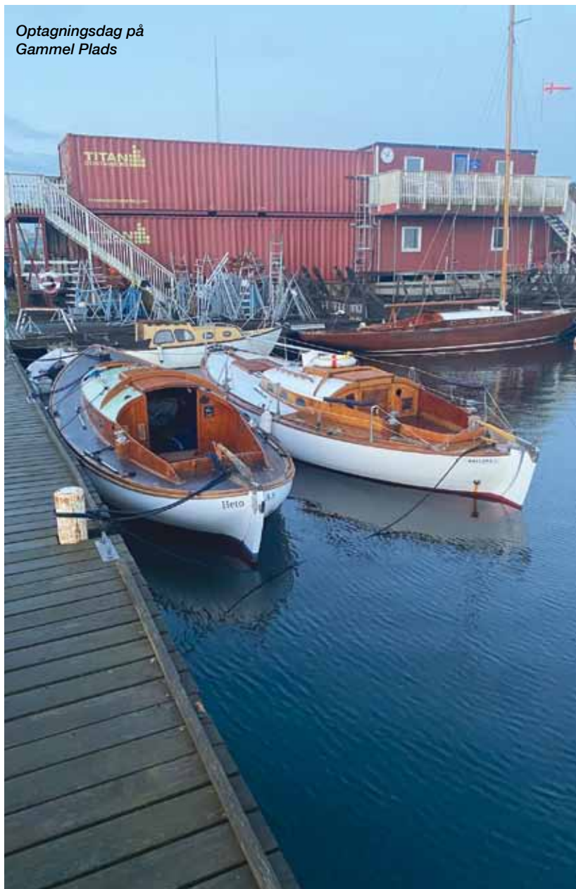
Optagningsdag på Gammel Plads