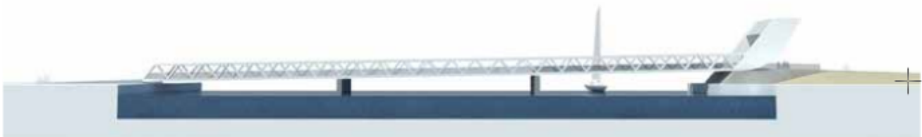
Figur 2.8 Klapbroen er ca. 130 meter lang og ca. 5 meter høj.

Oven i tunnelprojektet planlægges der desuden etablering af en cykelsti forbindelse tværs over havnindsejlingen som, hvis udført som lavbro, effektivt vil forsegle Svanemøllehavnen og Kalkbrænderihavnen og gøre dem uanvendelige som havn for både ført for sejl alene.