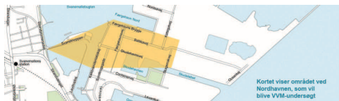
Området hvor der skal anlægges en Nordhavnstunnel.